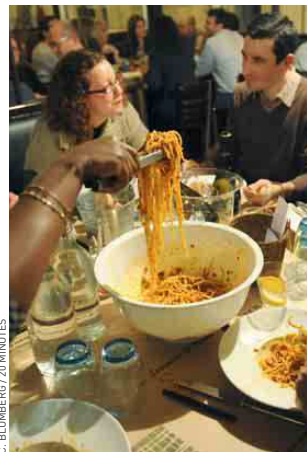
Hier soir à la Terrasse Saint-Pierre.